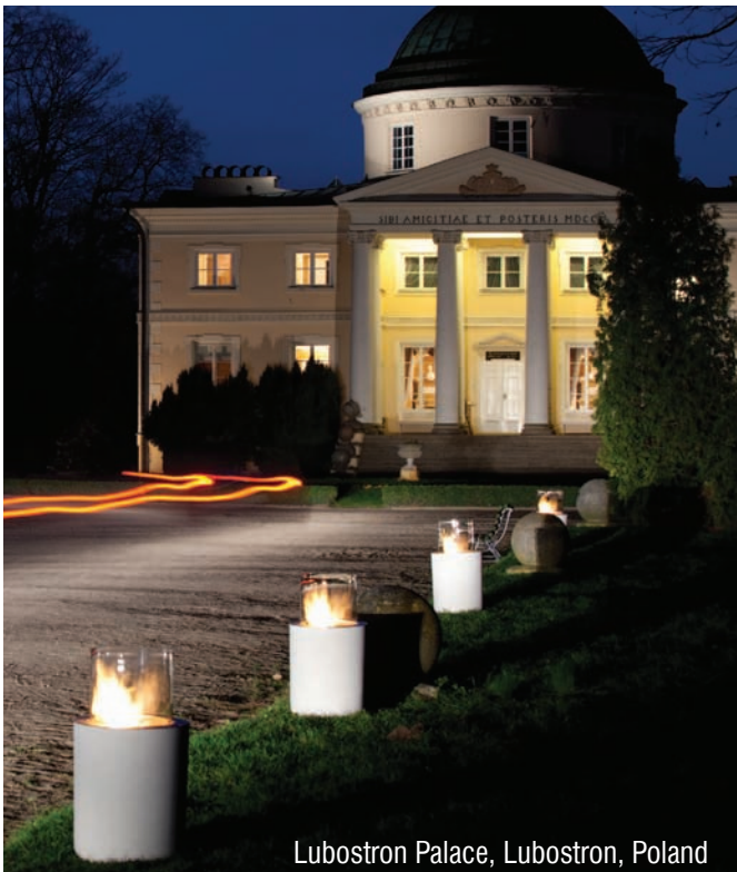
Lubostron Palace, Lubostron, Poland