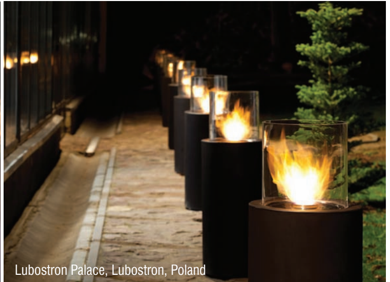
Lubostron Palace, Lubostron, Poland