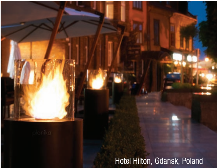
Hotel Hilton, Gdansk, Poland