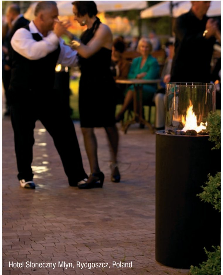
Hotel Słoneczny Młyn, Bydgoszcz, Poland