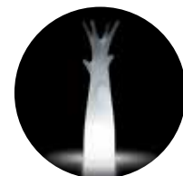
Versione light / Light version