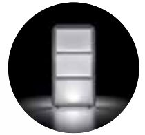
Versione light / Light version