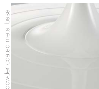
powder coated metal base