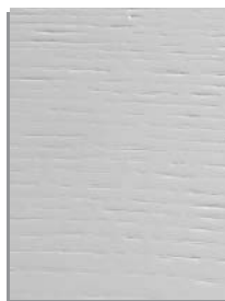
rovere lacc. poro aperto (disponibile in tutta la gamma colori) matt lacquer open pore oak (available in all the colour range)