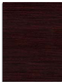
rovere moro oak in mahogany finish