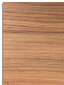
noce canaletto black American walnut