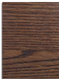
rovere tabacco oak in tobacco finish