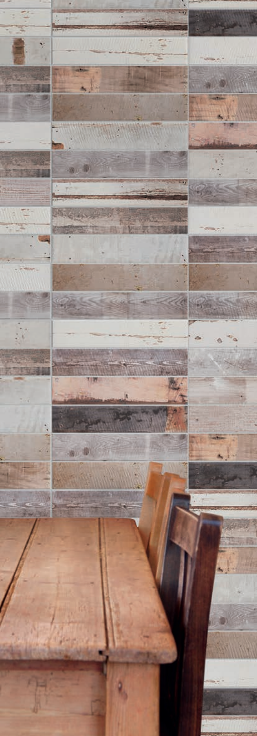
bianco PRT101M ■ 05