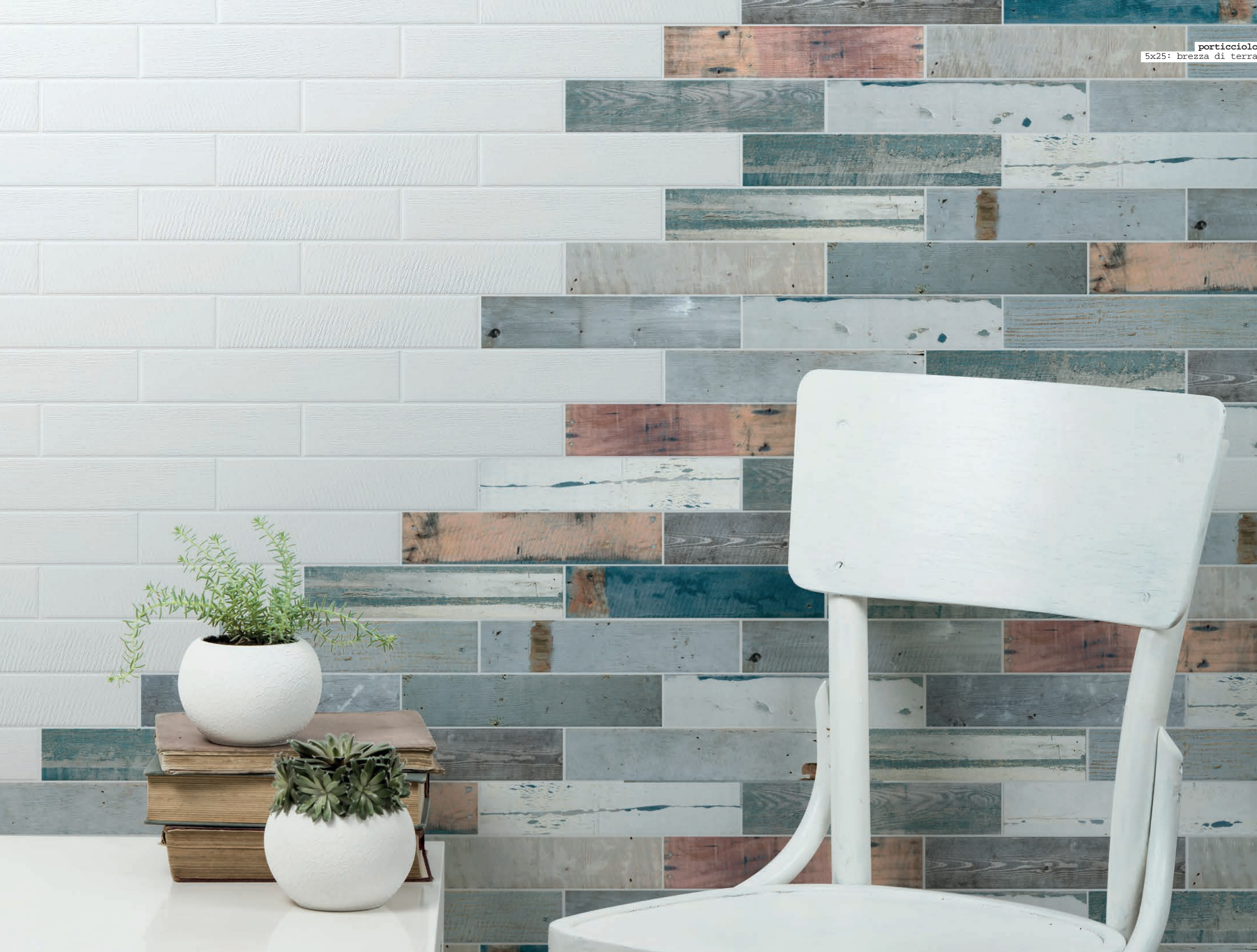
porticciolo 5x25: brezza di terra

por portio porticci porticci porticciolo portio porticci