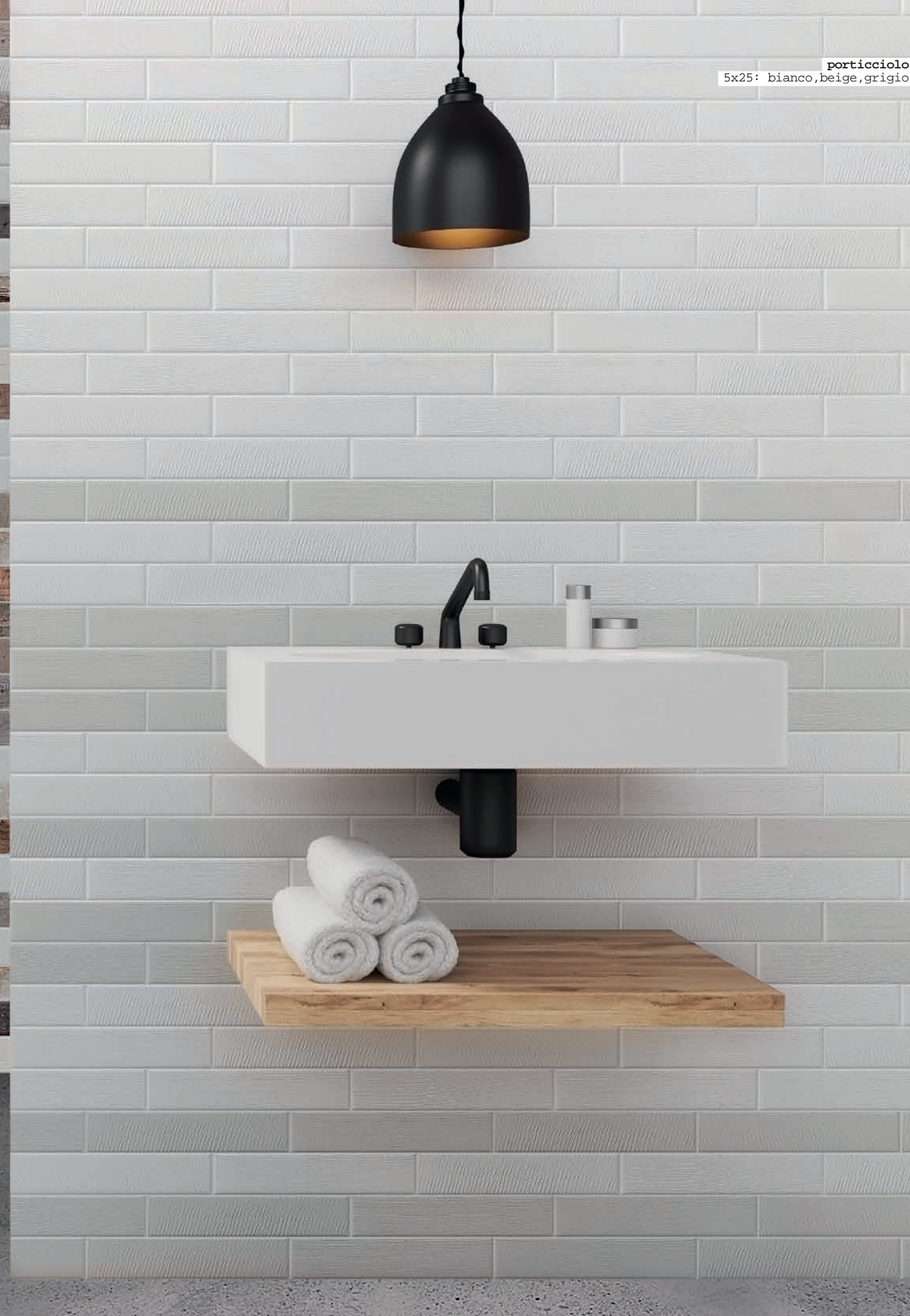
porticciolo 5x25: bianco, beige, grigio

por portio porticci porticci porticciolo portio porticci