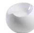
White Glossy Bianco Lucido

Elio is available in the standard colours of white gloss and black gloss.