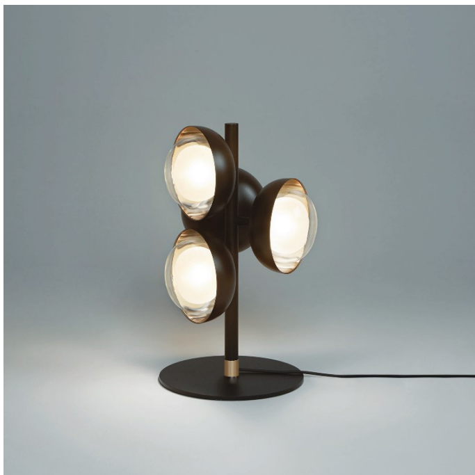
TABLE LAMP 554.35

Struttura realizzata da fusto centrale, bracci, e base circolare in metallo, verniciati a polveri epossidiche. Le cupole (esterna ed interna) creano l'effetto del doppio colore e incorniciano il lume. Vetri sferici in borosilicato a doppia parete Ø16.